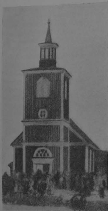
Karesuando gamla kyrka.

tan som en förvisning. Men även han själv var en mycket sammanfattad natur, en motsatsernas man. Hans svenska blod var blandat med en mindre del samiskt både från fädernet och modernet. Han säger ock om sig själv, att han ärvt faderns häftiga lynne och moderns melankoliska temperament. Han kände även det andliga mörkrets och begärens makt av egen erfarenhet. Men han kämpade tappert mot