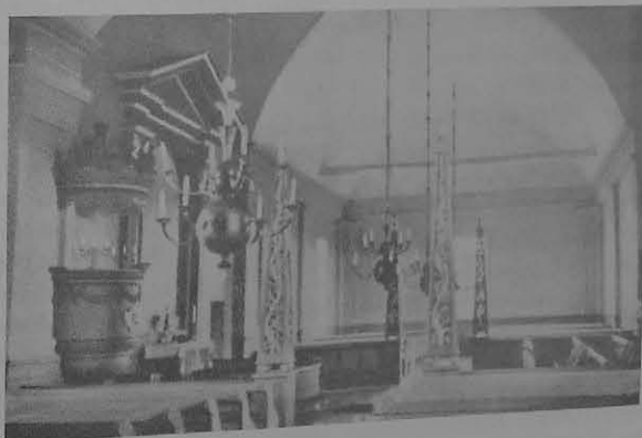
Pajala nya kyrka, interiör med Læstadius' predikstol.

Trots mycket nitiskt prediko-, undervisnings- o. enskilt själavårdsarbete hann L. även med en betydande författarverksamhet. Utöver talrika naturvetenskapliga artiklar må följande böcker nämnas: Biblisk historia , varigenom han blev grundare av det nord- eller tornelapska skriftspråket , 1844; en ej tryckt bok om Lapparnas mytologi och religion . Han utgav 1852—54