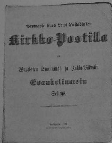
Læstadius första postilla.

satir och ironi såsom: "nyktra fyllhundar, fredliga slagskämpar, ärliga nådetjuvar, kyska skökor" o. d. (se ordförkl.), målades helvetets kval, så att åhörarna liksom kunde se, huru de fördömda vred sig som maskar i avgrundens lågor. Men sedan några blivit väckta, målades för dem himlens salighet så åskådligt som möjligt. Jesu lamm få beta och hoppa av glädje på himlens gröna ängar. De som här levit i fattigdom skola få all himlens härlighet. Kristi Brud skall bli så skön, att helgon och änglar åstunda att se hennes härlighet, när Brudgummen, klädd i blodröd segerkrud med guldkrone, hämtar henne. Læstadius säger, att hans predikningar fingo "en högre färg".