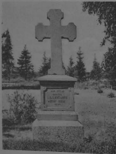
Læstadius' grav på Pajala nya kyrkogård.